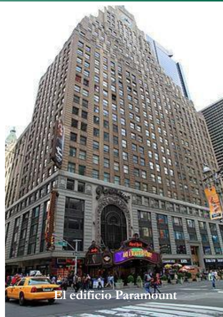
El edificio Paramount

Ubicada en Times Square, en el centro de "La gran Manzana", la escuela Christine Valmy está en el centro de todas las líneas de metro a poca distancia caminando de la terminal de buses Port Authority y de las estaciones del PATH Train.